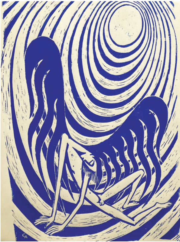
Abzug von der original Linolschnittplatte: „Sturz des Ikarus“)