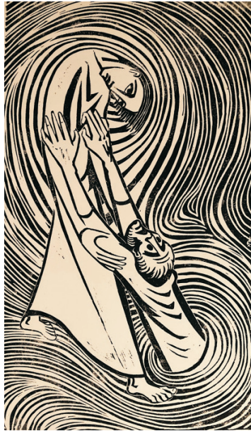
„In der vierten Nachtwache“ Der versinkende Petrus, (Mat. 14,27-31 NT)