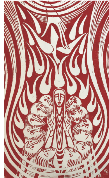
„Das Pfingstwunder“ (Apg. 2,4 - 13 NT)