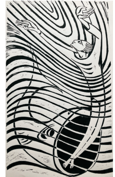
„Der Prophet Jona entspringt dem Walfisch“ (Jona 1,1 – 2,11)